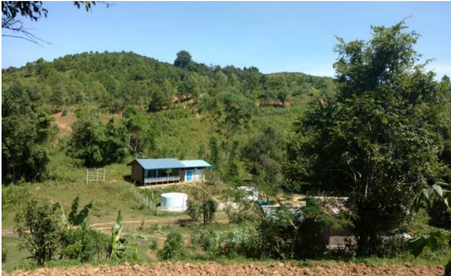
ကျေးရွာအုပ်စု မြောက်ပိုင်းမှ တောင်ကုန်းများပေါ်သည့် အိမ်ဖတ်ကျေးရွာ ပတ်လည်မှ တောင်ယာမြေများ

အမျိုးသမီးများသည် ချုပ်လုပ်ခြင်း၊ ပေါင်းသင်ခြင်း၊ ရိတ်သိမ်းခြင်းနှင့် ခြွေလှည့်ခြင်း တို့ကို လုပ်ကိုင် ကြသည်။ အမျိုးသားများက မြေကို ရှင်းလင်းခြင်း၊ ထွန်ရက်ခြင်းနှင့် မြေယာပြုပြင်ခြင်း အလုပ်များကို လုပ်ကြသည်။