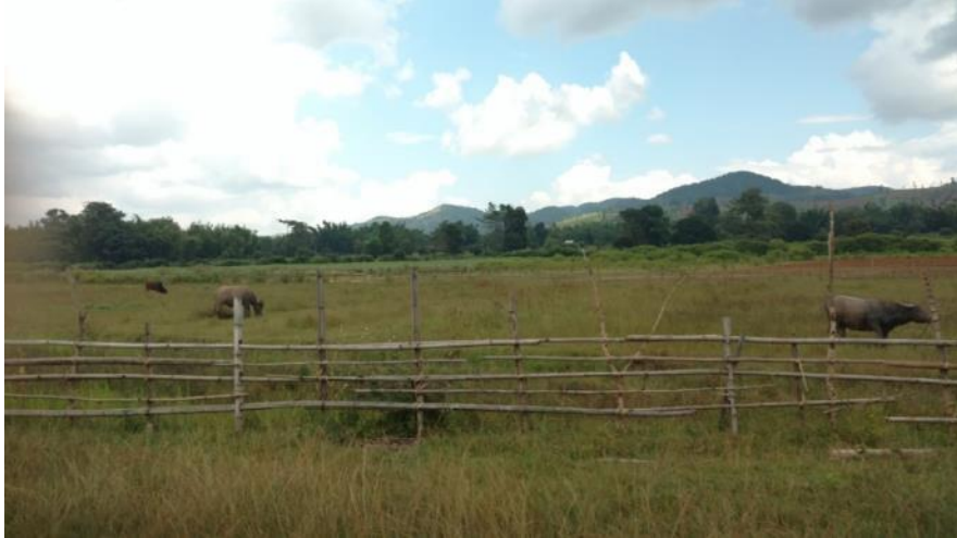
ကျေးရွာအုပ်စု တောင်ပိုင်း ကျောက်နားကတ်ရွာပတ်ဝန်းကျင်မှ မြေမှာ ပို၍ ညီညာပြန့်ပြူးပြီး မြေသြဇာပို၍ ကောင်းသည်။

တောင်ယာမြေများမှာ ရွာမြေ၏ ပြင်ပတွင် ဖြစ်သော်လည်း ကျေးရွာနယ်နိမိတ်အတွင်းတွင်ပင် ရှိသည်ဟု ရွာသားများက ယူဆထားကြသည်။ တောင်ယာမြေများတွင် အဓိကအားဖြင့် ဂျင်းနှင့် ခြောက်သွေ့ဒေသ စပါး အဓိက စိုက်ပျိုးပြီး ဆောင်းရာသီရှိ ပြောင်းနှင့် ပဲအမျိုးမျိုးကိုလည်း အနည်းငယ် စိုက်ပျိုးသည်။ ဂျင်းသည် အဓိက ရောင်းချသည့် သီးနှံ ဖြစ်သည်။ စပါး၊ ပဲ၊ ပြောင်း၊ ဂျုံနှင့်